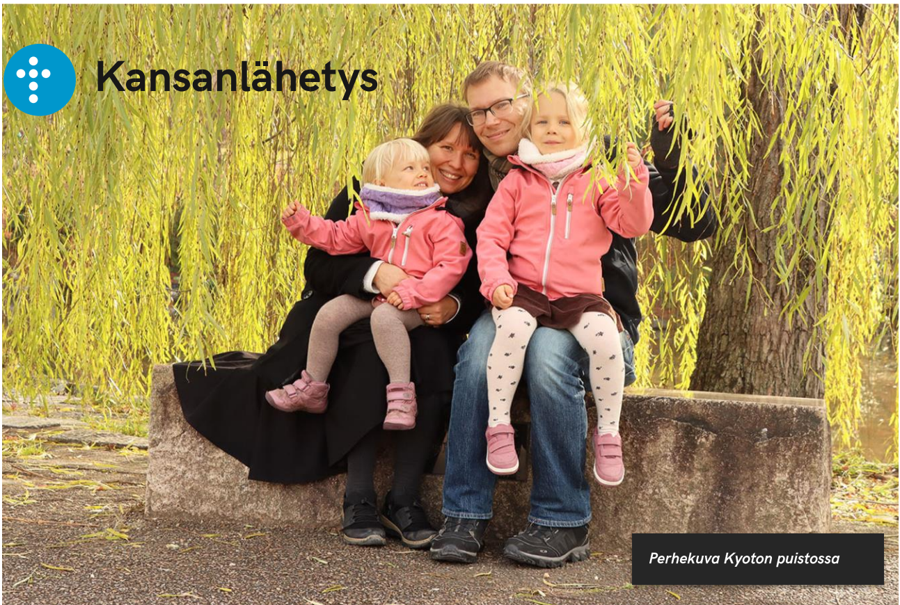
Perhekuva Kyoton puistossa