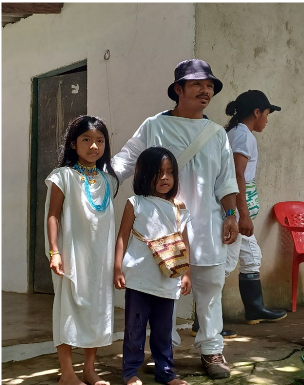
Kogui-lapset saavat oppia äidinkielellään

Uudet hankkeet ovat alkaneet myös, vaikka pääosin mennäänkin samoja polkuja: teologista koulutusta, kristillistä opetusta, lasten koulunkäynnin tukemista, naisten aseman vahvistamista kirkon sisällä ja sen ulkopuolella, rauhantyötä Maria Magdalena -talossa (joka aikaisemmin oli nimeltään Rauhan talo), kyläyhteisöjen kestävyuden tukemista ja alkuperäiskansojen tukemista omakielisen ja -kulttuurisen opetusmallin luomiseksi. Toinen kumppanimme Luterilainen maailmanliitto jatkaa työtä miinaonnettomuuksissa vammautuneiden parissa ja yhteisöjen kestävyuden vahvistamisessa. Meillä on Kolumbiassa vahvat ja kokeneet yhteistyökumppanit, jotka tietävät mitä tekevät!