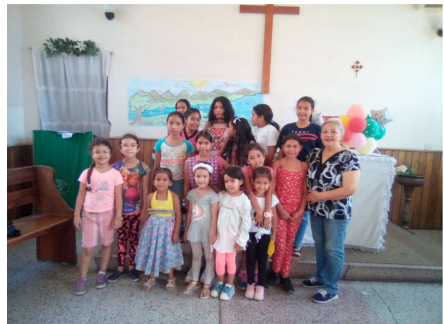
San Blas in esikoululapsia