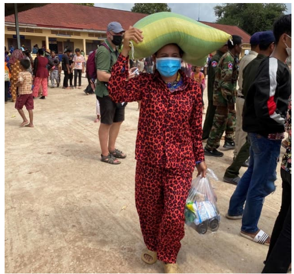
Tulva-apua jaettiin yli 400 ihmiselle 21.11.