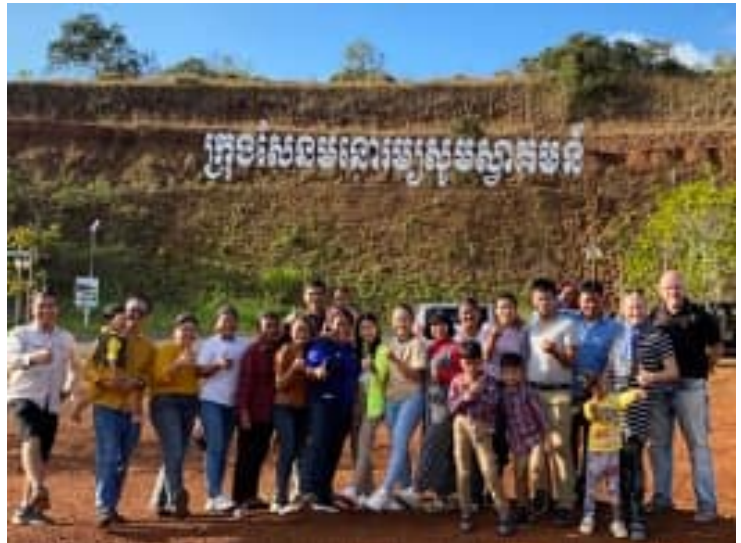
Perheneuvojat perheineen ovat juuri saapuneet 28.11. Mondulkiriin dialogiseen suhdeseminaariin ajettuamme 10 tuntia.