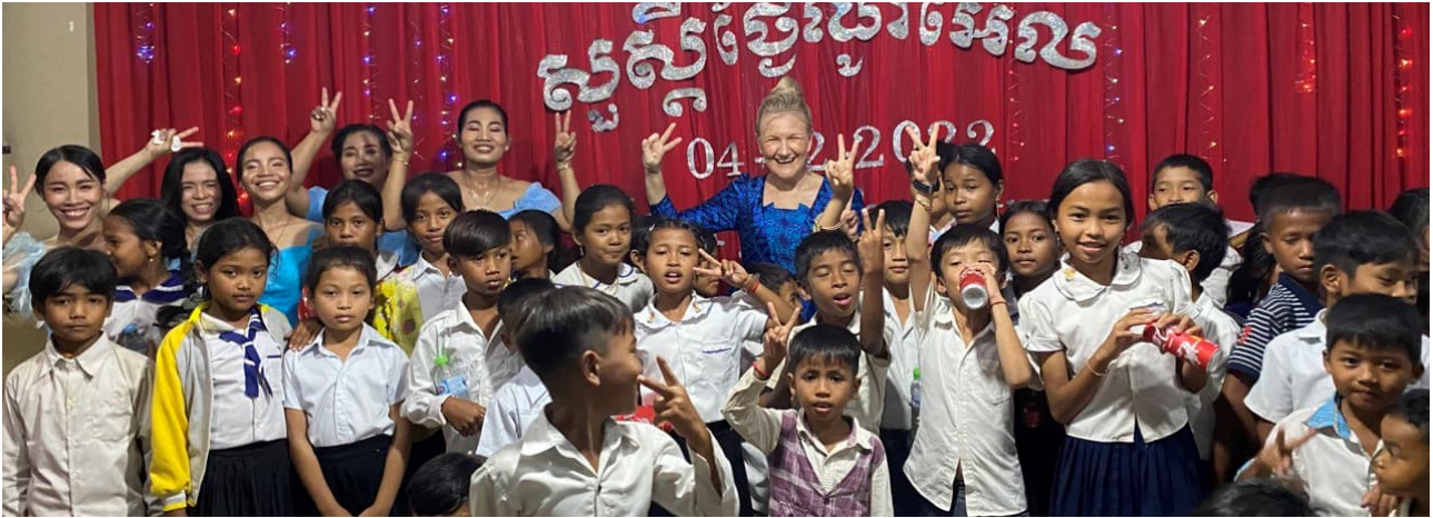
Krousin seurakunnan joulujuhlissa ilo oli ylimmillään 4.12.

Jos lienet halpa kedon paimen, ylistä Herraa kuitenkin. Hän saattaa kasvuun pienen taimen sateessa päivin lämpimin. Hän synkimpäänkin sopukkaan saa joulun tähden loistamaan. (SV 194:4)