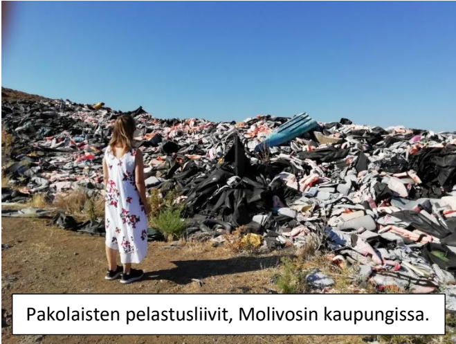
Pakolaisten pelastusliivit, Molivosin kaupungissa.

väkivalta hallitsevat. Eräs nuori mies kertoi nukkuneensa, kun 8 miestä tunkeutui seinän läpi ja vaati puukko kurkulla antamaan kännykän ja rahat. Yöllä naiset eivät uskalla mennä vessaan eivätkä muutenkaan liikkua.