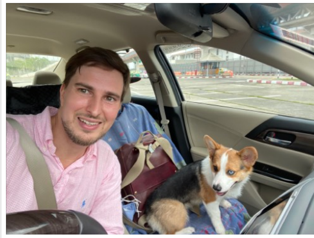
Kuvassa vasemmalla: Ensimmäinen pitkä ajomatka Lunan kanssa sujui melko hyvin. Vaikka varsinaisia vaaratilanteita ei ollut, ajoin kerran moottoritietä harhaan ja juuri kun olin hermostuksissani huomannut virheeni, Luna halusikin yhtäkkiä ulos lenkille ja ilmaisi tahtonsa todella äänekkäästi.

Rokotusmatkalle Suomeen tullessamme olimme jättäneet Suomen Lähetysseuran Bangkokin konttoriin kolme isoa matkalaukullista vaatteita ja muuta tavaraa. Tavaramäärän ja Luna -koiran takia päätin vuokrata auton ja ajaa noin 900 kilometriä Bangkokista Chiang Raihin. Koska on sadekausi ja pelkäsin mahdollisia tulvia ja onnettomuuksia enkä halunnut ottaa riskiä, jaoin matkan kolmeen päivään pysähtyen Tak ja Chiang Mai -nimisissä kaupungeissa. Chiang Maissa tapasin entisen