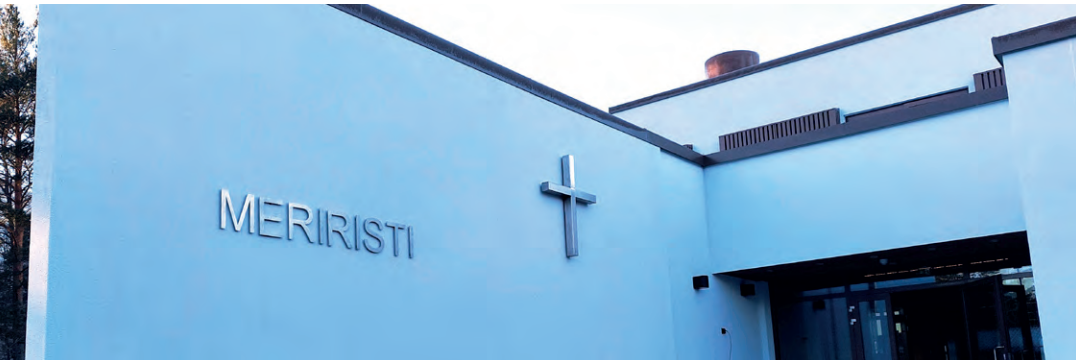
Kuva: Meriristin ulkopinnan väri on muuttunut tiilenpunaisesta valkoiseksi. Sisätiloissa värit piristävät seinää.